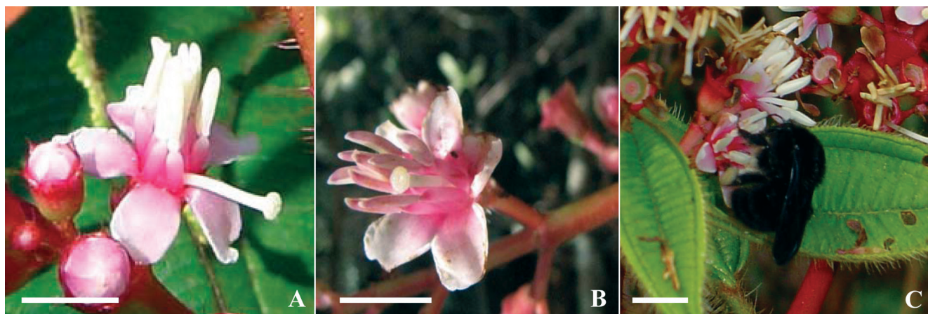
Figura 1 - Flores de Tococa guianensis no Parque Estadual do Rio Preto, Minas Gerais, Brasil. A – logo após a antese (6:00 h), exibindo, separação espacial do estigma e estames; B – flor exibindo deslocamento do estilete para o centro da flor; C – sendo visitada por Bombus morio . As barras brancas representam escalas de 1 cm.

O pólen é a única recompensa oferecida pela flor. Logo após a antese (06:00h), as tecas apresentam grande quantidade de pólen, que decresce significativamente ao longo do dia ( F = 48,273 ; p < 0,001 ), de modo que em torno das 16:00 h, elas estão praticamente vazias (Tab. 1). A viabilidade do pólen decresce com o passar do tempo ( F = 6,775 ; p < 0,05 ), caindo de 87% às 06:00 h para 60% às 16:00 h (Tab. 1).